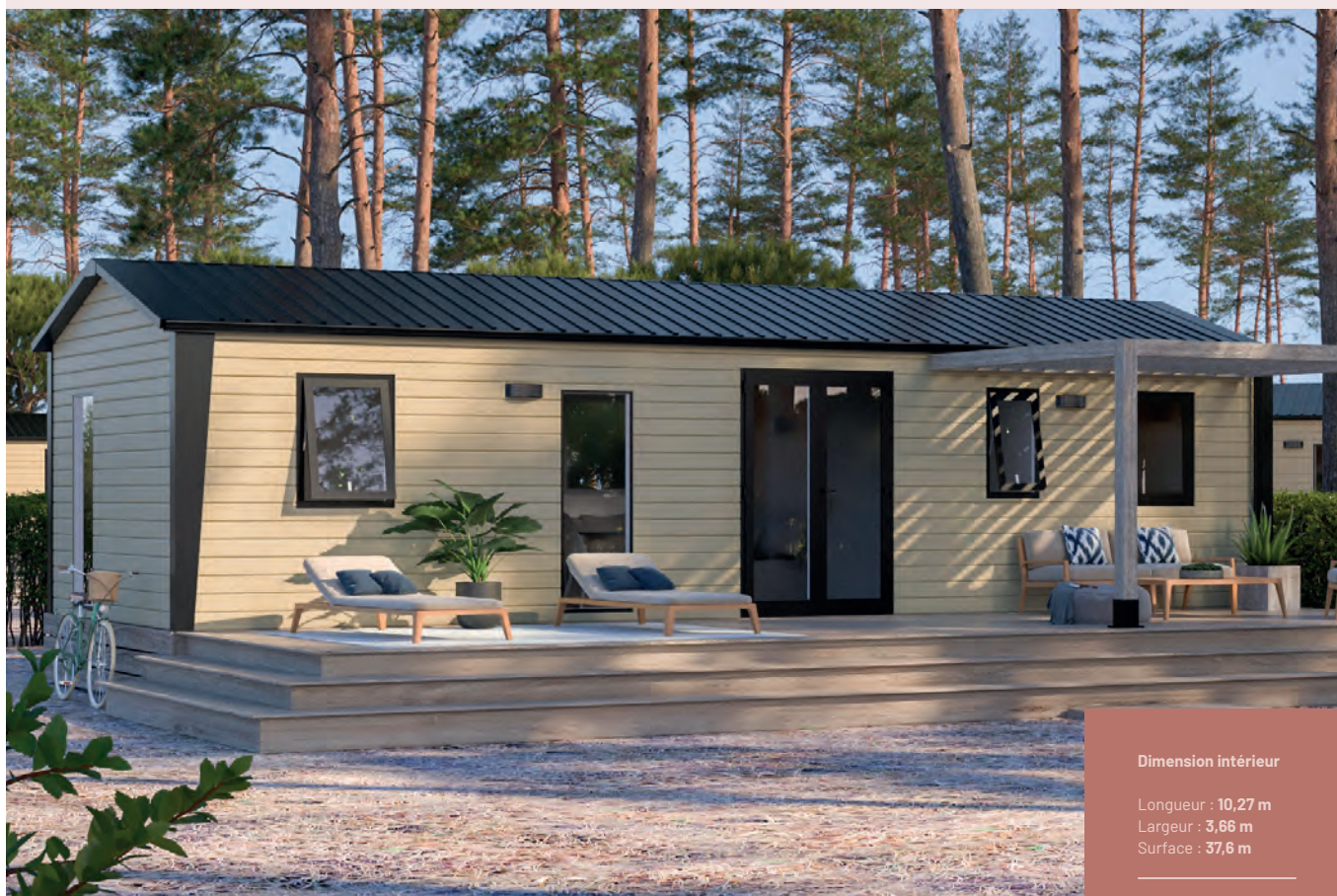
Options bardage cappucino & menuiseries anthracite